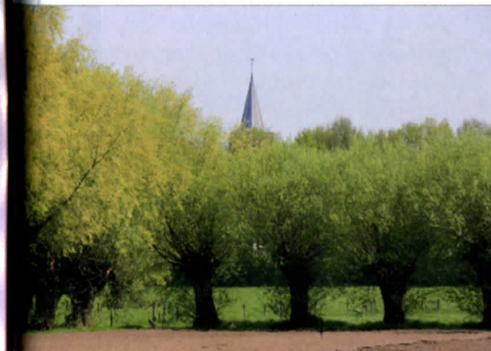
Knotwilgenrijen in het dal van de Smalle Beek.

er, op regelmatige afstand, weer natuurlijke elementen worden aangelegd. Niet alleen mobiele dieren als vogels, vlinders en libellen reageren hier gunstig op, maar ook ‘trage’ als amfibieën. Ze moeten dan wel in hun element kunnen zijn, wat wil zeggen voedsel verzamelen, zich verschuilen en voortplanten. De leefgebiedjes in een evz zijn als geheel te vergelijken met een kralensnoer en heten in vakjargon ‘stapstenen’. In het geval van de Smalle Beek zijn het er 11 over een lengte van 5,5 km. De gezamenlijke oppervlakte bedraagt 9 hectare, wat niet veel is, maar hier geldt het principe dat het geheel meer is dan de som der delen. De meerwaarde zit hem vooral in het effect, in het ‘migrerend vermogen’ dat de stapstenen bevorderen. De gronden zijn eigendom van Waterschap Brabantse Delta en de gemeente Roosendaal (waar Wouw onder valt), maar het initiatief kwam van het Coördinatiepunt . Die kreeg van de Provincie de taakstelling mee om dat provinciebreed te herhalen voor 1600 km aan evz, onder te verdelen in 1250 km nat en 350 km droog. Wegens langlopende procedures hebben we dat nog maar voor 300 km kunnen doen. We staan te popelen om door te gaan.